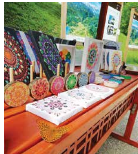
Prodaja v Vintgarju