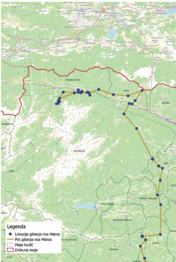
Karta gibanja risa Maksa od izpusta na območju Notranjske pa vse do zadnjih lokacij gibanja na Gorenjskem.