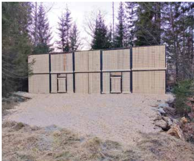
Prilagoditvena obora na območju lovišča Lovske družine Nomenj - Gorjuše.

Priprave na doselitve risov potekajo že od začetka trajanja projekta. Najprej smo začeli s predstavitvami projekta ter sestanki z zainteresiranimi upravljavci. Za tem smo pridobili vsa potrebna dovoljenja ter postavili 2 prilagoditveni obori na Pokljuki ter Jelovici. Z lovci smo tedensko v stiku, priprave na prihod pa se bodo začele po tem, ko bodo živali odlovljene in pripravljene na doselitev. Takrat bo potrebno še enkrat pregledati stanje obor, urediti okolico ter zagotoviti potrebno hrano. Rise v obori bodo hranili in dnevno preverjali lovci, potrebno pa bo preprečiti tudi nezaželene obiske ljudi ter s tem vznemirjanje risov. Lovci bodo z nami sodelovali tudi pri spremljanju risov po izpušnih ter mnogih drugih projektnih aktivnostih.