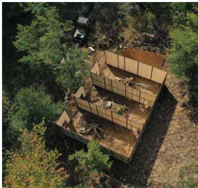
Priložitvena obora na območju Triglavskega narodnega parka.

Vsakega od petih doseljenih risov bomo sprva namestili v že pripravljene priložitvene obore, opremili s telemetrično ovratico ter ga po izpustu spremljali pri vključevanju v novo naravno okolje. V primeru, da se ris ne bi vključil v novo okolje (npr. bo zapustil alpsko območje) ali se bo z njim zgodilo kaj nepredvidljivega (npr. smrt zaradi povoza), bomo ta osebek poskusili nadomestiti z novim.