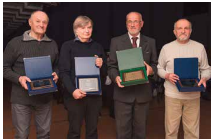
2. aprila je ŠD Gorje praznovalo 100 let delovanja. Več na strani 12.