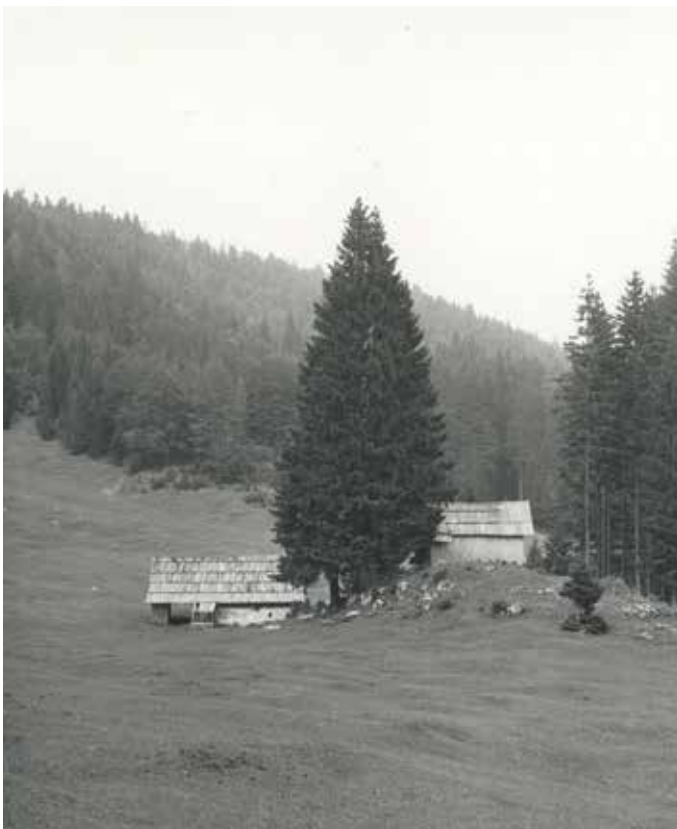
Planina Zgornji Kozjek na Mežakli, leto 1968

Z ledinskimi imeni so naši predniki poimenovali svoj življenjski prostor, da so se v njem znašli. Treba je bilo jasno povedati, kam gre gospodar kositi, kam naj otroci ženejo živino, kje raste največ borovnic, kje so jagri ustrelili gamsa in kje se otroci zberejo za popoldansko igro. Danes se pomen imen s spremembami v načinu življenja in ob vedno manjši odvisnosti in povezanosti ljudi z naravo izgublja, zato tudi imena tonejo v pozabo. Najpomembnejša še živijo, tista najmanjša, ki lahko poimenujejo le nekaj metrov veliko območje, pa izginjajo v pozabo. Zaradi tega je Razvojna agencija Zgornje Gorenjske ob financiranju Občine Gorje pričela z zbiranjem imen v gorjanski občini. V prvem koraku je bilo zbiranje osredotočeno na območje katastrskih občin Podhom in Spodnje Gorje. S pomočjo domačinov je bilo zbranih več kot 210 domačih poimenovanj za travnike, polja, pašnike, gozdove, poteke, druge naravne pojave ter objekte v prostoru. Tako so imena zbrana na območjih od Petelina na Mežakli do Sebenj med Podhomom in Zasipom. Večine med njimi ni na uradnih zemljevidih, temveč živijo le med ljudmi.