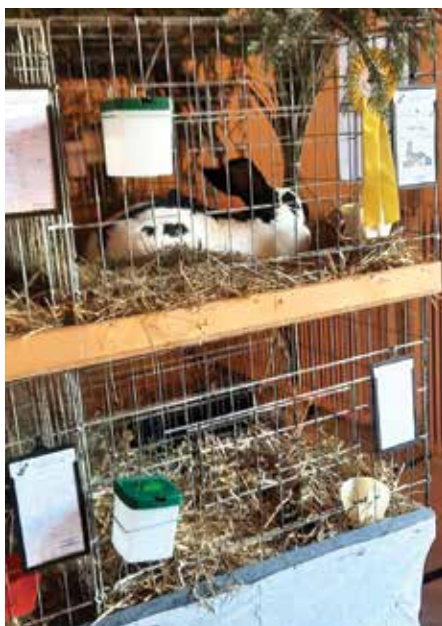
Kunci v Gorjah