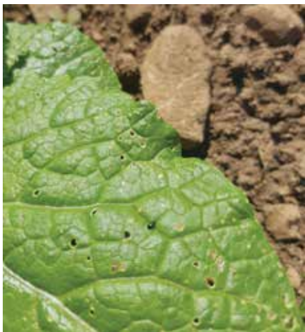
Bolhač na kitajskem kapusu.

Konec avgusta sejemo toplotno manj zahtevne vrtnine s kratko vegetacijsko dobo; zimsko solato, špinačo, blitvo, mesečno redkvico, terminsko sejemo motovilec. Porežemo lepe, zdrave vršne potaknjence balkonskega cvetja in pripravimo potaknjence za naslednjo vegetacijsko dobo. Potaknjence režemo vse do konca vegetacijske dobe. Očistimo spomladi cvetoče čebulice in jih pripravimo za jesensko sajenje. Režemo še zadnja zelišča in jih pripravimo za sušenje. Proti koncu meseca septembra izkoplujemo korenovke in jih posadimo v lonce z vlažno mivko. Korene lahko posadimo pokončno, manjše korene lahko shranimo v večkratnih plasteh v kombinaciji mivka-