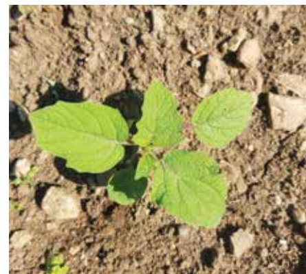
Sadika perujskega volčjega jabolka.