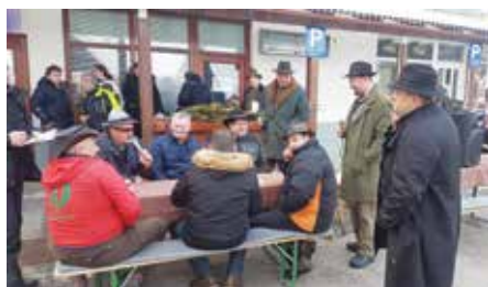
Licatorji in ploharji

Po kar petih letih so se gorjanski fantje odločili, da obudijo staro tradicijo vleke ploha. Namen vleke je odganjanje zime in priklic plodne pomladi. Ker se nobeno dekle med božičem in pustom ni omožilo, so se fantje na vasi zbrali ter v razmislek dekletom vlekli ploh skozi vas do vaškega trga.